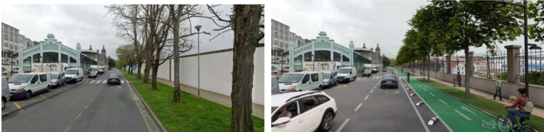
Tramo 2: vista xeral actual e infografía: